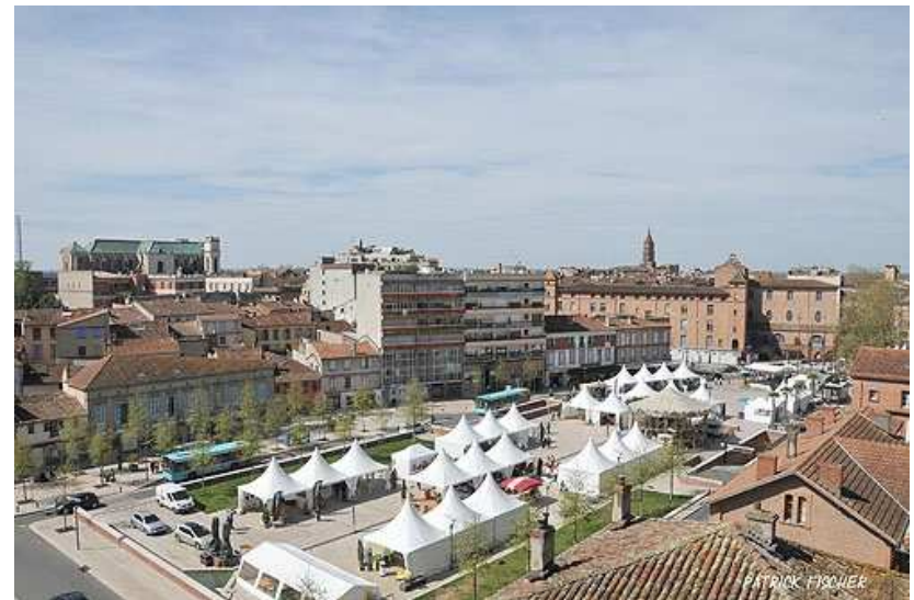
Vue panoramique sur le Village Marathon