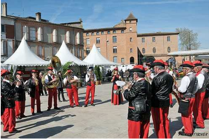
Le Village Marathon en musique